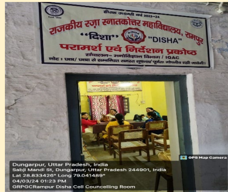
Dungarpur, Uttar Pradesh, India Sabji Mandi St, Dungarpur, Uttar Pradesh 244901, India Lat 28.833426° Long 79.041489° 04/03/24 01:23 PM GRPGCRampur Disha Call Counselling Room