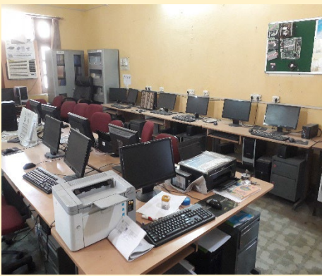
Dungarpur, Uttar Pradesh, India Sabji Mandi St, Dungarpur, Uttar Pradesh 244901, India Lat 28.833426° Long 79.041489° 30/11/23 02:44 PM GRPGCRampur IQAC GPS Photography Training