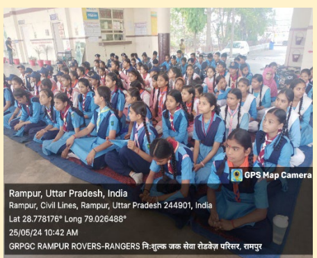
Rampur, Uttar Pradesh, India Rampur, Civil Lines, Rampur, Uttar Pradesh 244901, India Lat 28.778176° Long 79.026488° 25/05/24 10:42 AM GRPGC RAMPUR R'OVERS-RANGERS नि:शुल्क जूक सेवा रोडवेज परिसर, रामपुर