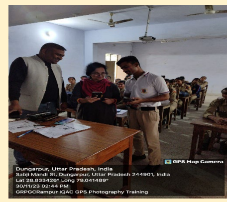
Dungarpur, Uttar Pradesh, India Sabji Mandi St, Dungarpur, Uttar Pradesh 244901, India Lat 28.833426° Long 79.041489° 30/11/23 02:44 PM GRPGCRampur IQAC GPS Photography Training