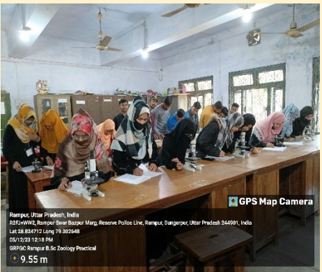
Rampur, Uttar Pradesh, India R2F-IWV2, Rampur Bazar Marg, Reserve Police Line, Rampur, Dungarpur, Uttar Pradesh 244901, India Lat 28.824712° Long 79.032548° 09/12/23 12:18 PM GRPGC Rampur B.S.Sc. Zoology Practical 9.55 m