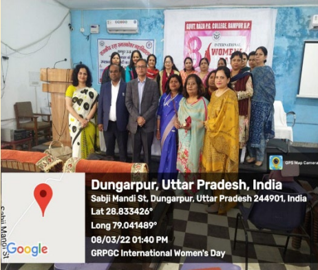
Dungarpur, Uttar Pradesh, India Sabji Mandi St, Dungarpur, Uttar Pradesh 244901, India Lat 28.833426° Long 79.041489° 08/03/22 01:40 PM GRPGC International Women's Day