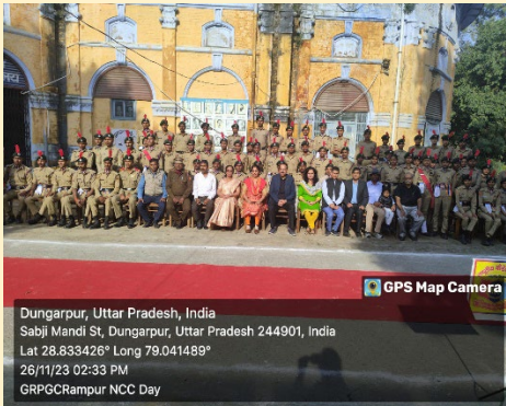
Dungarpur, Uttar Pradesh, India Sabji Mandi St, Dungarpur, Uttar Pradesh 244901, India Lat 28.833426° Long 79.041489° 26/11/23 02:33 PM GRPGC RAMPUR NCC Day