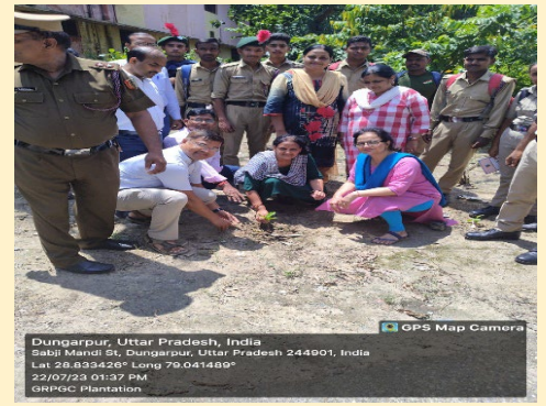
Dungarpur, Uttar Pradesh, India Sabji Mandi St, Dungarpur, Uttar Pradesh 244901, India Lat 28.833426° Long 79.041489° 22/07/23 01:37 PM GRPGC Plantation